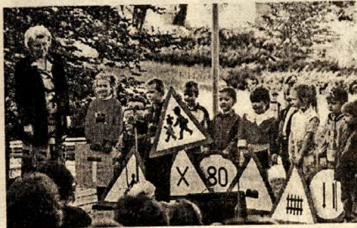
Vystoupení dětí z chraštické MŠ, kteří si pro svoji scénku velice pěkně připravili dopravní značky.

Po mši se návštěvníci přesunuli do školy, kde byla slavnostně zahájena výstava o historii školy. Všichni přítomní si zde na několika panelech mohli prohlédnout desítky fotografií, které mapují vše, co se na této škole během posledních 40 let dělo. Jistě to byl pro všechny zúčastněné zajímavý pohled, protože nynější