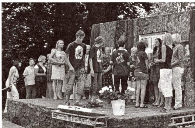
Před svým představením si žáci deváté třídy pozvali na pódium všechny kantory, kteří se jim od první třídy mateřské školy až do deváté třídy školy základní věnovali

Letošní deváťáci by svým počtem nestačili na obsazení všech postav, a proto využili nabídky přátel z dramatického kroužku, kteří jim velice úspěšně sekundovali. Pro ty, kteří pohádku Láďo, ty jsi princezna? v podání chraštických školáků neviděli – věřte, že jste skutečně o moc přišli. Za diváky mohu říci: děkujeme za příjemný zážitek. eš