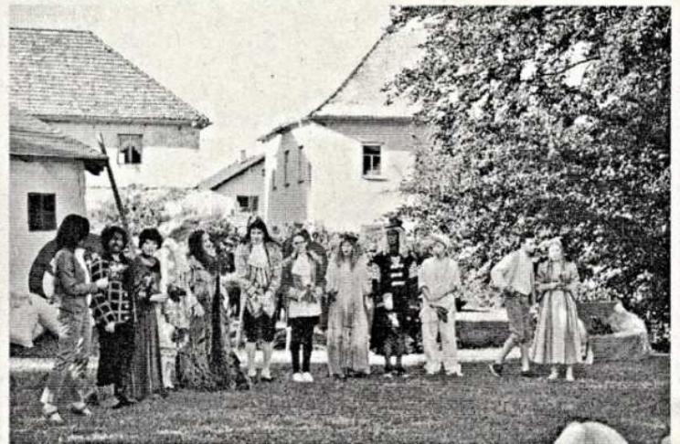
Vedení chraštické školy, učitelé, rodiče, všichni kdo se jakýmkoliv způsobem na přípravě divadelního představení podíleli, mohou být pyšní, povedlo se