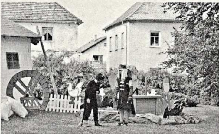
Příběh, ve kterém jsou čertík a vodník zamilovaní do mlynářovy dcery „Élišky“, jistě všichni znají, chraštíčtí deváťáci si jej zahráli

běžka (2002), Limonádový Joe (2003), Tři mušketýři (2004), Lotrando a Zubejda (2005), Princové jsou na draka (2006), S čerty nejsou žerty (2007), Co takhle svatba, princí (2008), Ať žijí duchové (2009), Šíleně smutná princezna (2010), O princezně, která ráčkovala (2011), Láďo, ty jsi princezna? (2012), Noc na Karlštejně (2013), Mrazík (2014), a samozřejmě letošní Princezna ze mlejna.