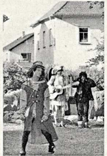
Výkony všech herců byly úžasné, ovšem čert a vodník již podstatou svých rolí mírně převyšovali

Povahou své role, ale i jejím samotným ztvárněním letos zaujali především čertík se svou hláškou „Já jsem malej, ale šikovnej“, a samozřejmě